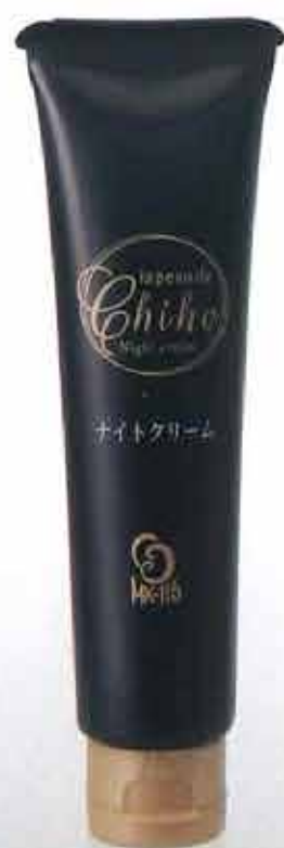
ラポーテチホ 〈ナイトクリーム〉30g メーカー希望小売価格 4,950円(税込)

乳酸菌 *1 配合で、肌を理想的なオイルバランスに。 年齢によって気になる肌トラブルをケアします。