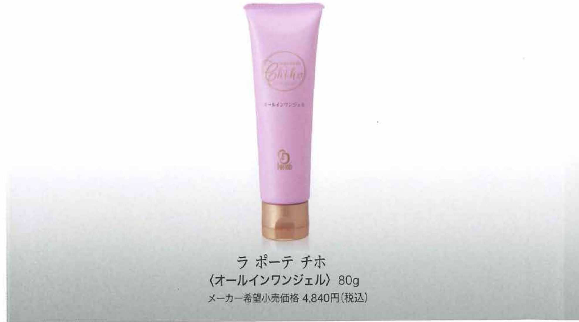
ラポーテ チホ 〈オールインワンジェル〉 80g メーカー希望小売価格 4,840円(税込)

乳酸菌 *1 配合で、肌を理想的なオイルバランスに ハリ・潤い成分を肌の奥(角質層)まで届けます。